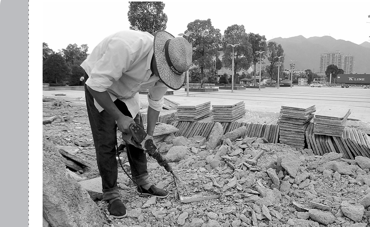
▲近日,灵湖公园的地面被挖开了不少,这是在做什么呢?据了解,由于灵湖公园的投入使用已有些年头,加上广场地面的不均匀沉降,造成了铺设的地砖高低不平,经常积水,给前来公园休闲的市民带来很大的不便。目前,施工人员正在对广场地面进行修复,预计9月底前完工。