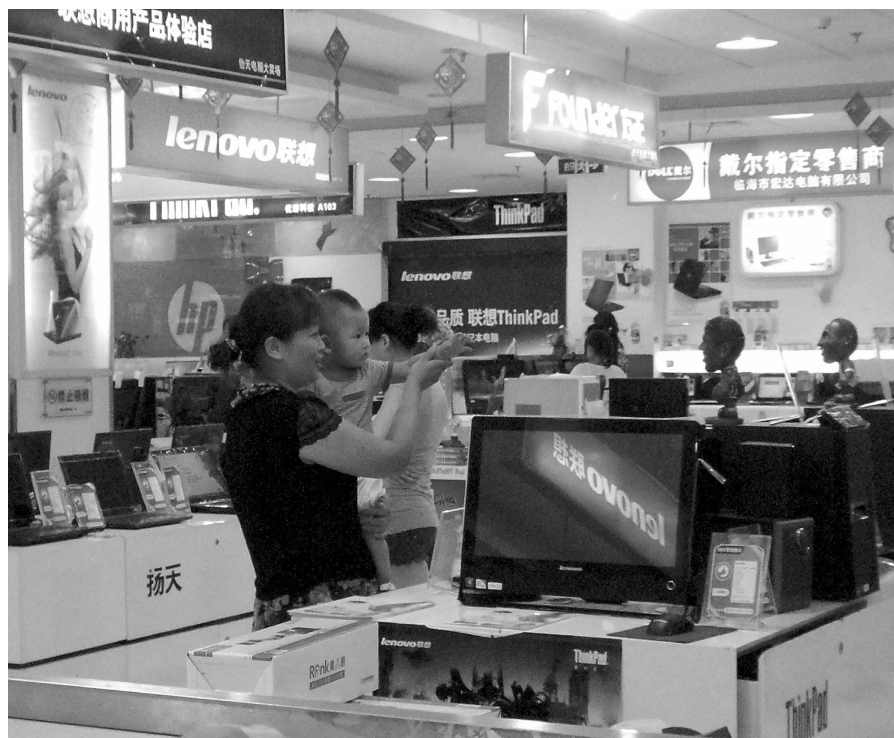
连日来的高温晴热天气让市民倍感不适。市民各出奇招避暑降温,其中,免费供应冷气的各大商场、超市便成了不少市民尤其是老人、孩子的避暑“胜地”。

来江边乘凉的人多了,环卫工人的负担也加重了,一位环卫工人告诉记者,晚上的垃圾量是白天的好几倍,尤其很多人用报纸垫着坐在地上,人走了,报纸就随手扔了,喝过的饮料空瓶也就摆在原地了。