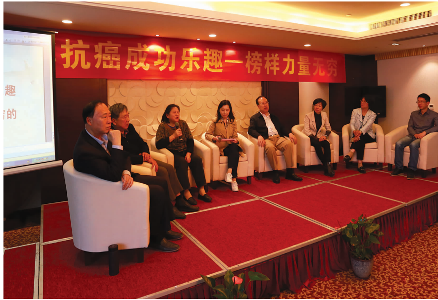
抗癌明星和专家在台上分享经验。

所以,治疗肿瘤需要病人、医生的共同努力。我作为一名医务工作者,肯定不能辜负病人们对我的期望,对得起病人每一份信任。