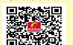
崇和电影二二维码